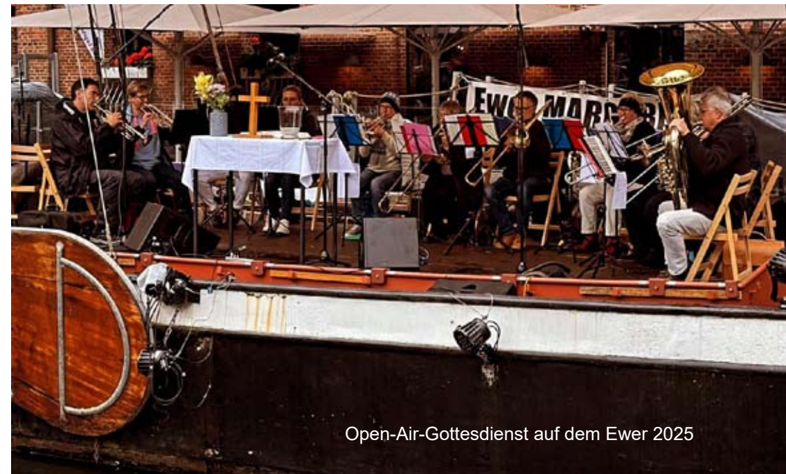
Open-Air-Gottesdienst auf dem Ewer 2025