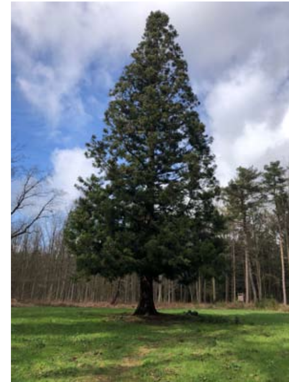
Japanische Sichelanne