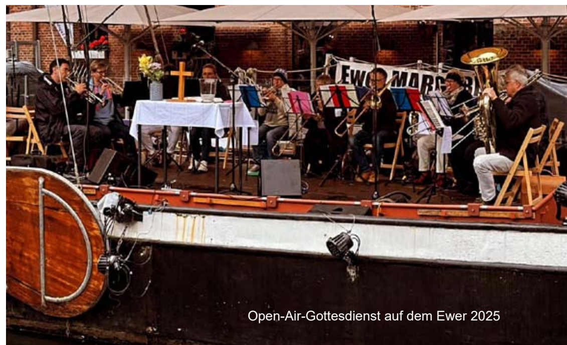
Open-Air-Gottesdienst auf dem Ewer 2025