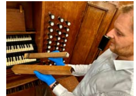
Schimmel an Pfeifen der Furtwängler-Orgel

Bis zum 30.12.2025 sind 12.835 Euro bei uns eingegangen. Damit ist ein wichtiger Baustein in der Finanzierung des Projektes realisiert. Die Orgelbaufirma Puschmann aus Rheine wird im Herbst über mehrere Wochen in der Orgel arbeiten und entfernt Schimmel und Schmutzablagerungen. Ich bin jetzt schon gespannt, wie die alte Dame von 1859 dann